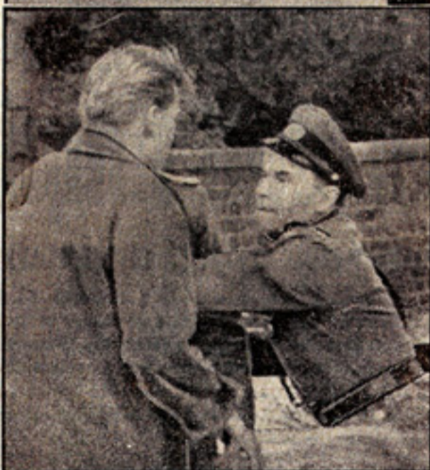
... und einer der Unteroffiziere, der die Wahrheit nicht vertragen kann, schlägt den Mann zusammen.