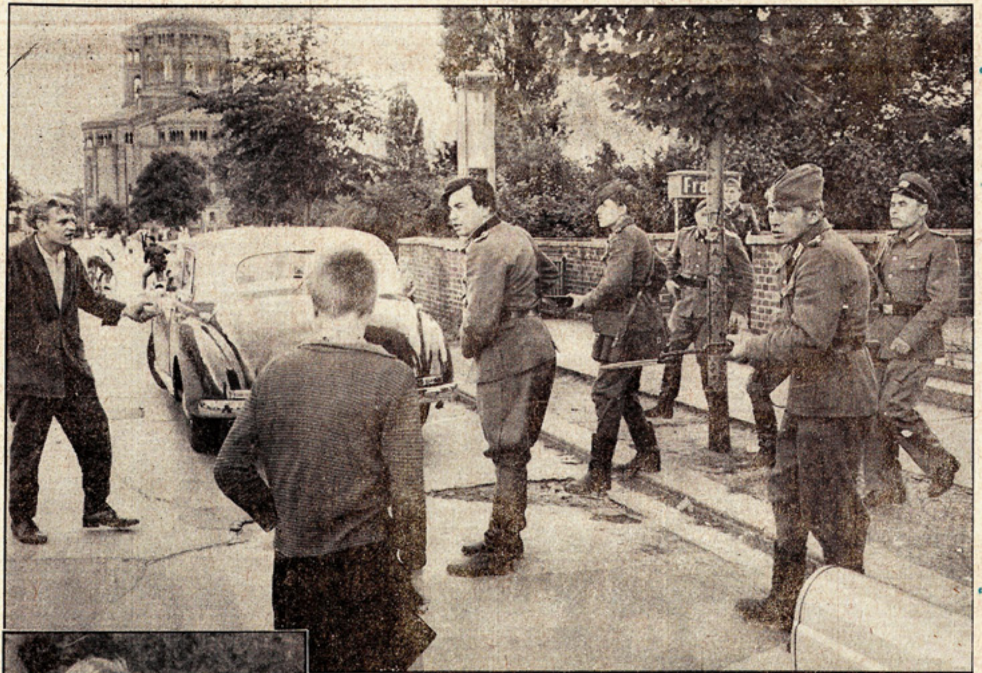
Zwischenfall in Ost-Berlin: Ein junger Arbeiter (links im Photo) schreit den „Volksarmisten“ seine Verachtung ins Gesicht. Sofort gehen sie mit aufgepflanztem Bajonett gegen ihn vor...

Jetzt ist der Westen am Zuge. Jetzt muß der Westen handeln.